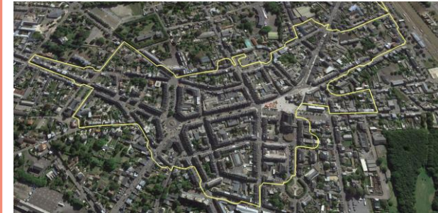
Flers (61) Centre ville